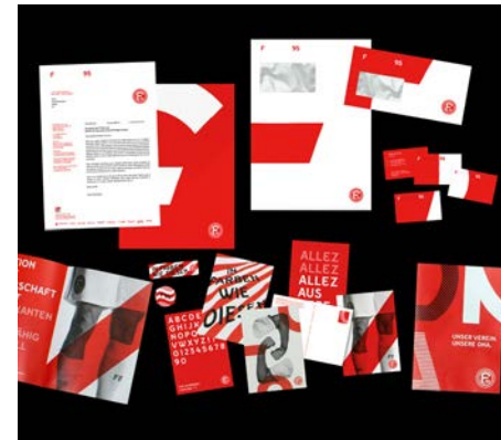
Fortuna Düsseldorf 1895 Brand Design Design: Morphoria, Düsseldorf, Germany Client: Fortuna Düsseldorf 1895 e.V., Düsseldorf, Germany Red Dot

North Rhine-Westphalia (NRW) is one of Germany's top creative locations – this is also reflected in the Red Dot Award: Communication Design. At 29%, almost one third of all German entries that won an award in 2018 were from agencies, creatives and companies in NRW (by comparison: in 2015, this figure stood at 18%). This is a clear indication that the creative industries in NRW are going from strength to strength, producing world-class quality. This is true for all categories in the competition, not just in specific areas. As a result, this year's exhibition is focusing in particular on works from the past four years that were either designed by creative minds from NRW or commissioned by companies based in NRW.