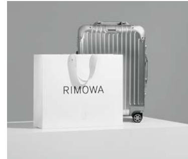
RIMOWA Corporate Design & Visual Identity Design: Bureau Borsche Munich, Germany; Commission Studio, London, United Kingdom Client: RIMOWA, Cologne, Germany Red Dot