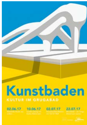
Kunstbaden Event & Exhibition Poster Design: Bureau Mombour, Essen, Germany Client: Kulturbüro Essen, Germany Red Dot