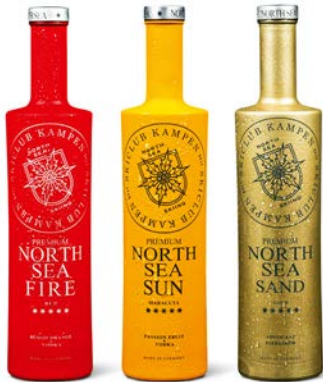
Skiclub Kampen – North Sea Spirits Beverage Packaging Design: Skiclub Kampen, Dortmund, Germany; We make shirts, Berlin, Germany Client: Skiclub Kampen, Dortmund, Germany Red Dot

Nordrhein-Westfalen ist einer der stärksten Kreativstandorte Deutschlands – das zeigt sich auch beim Red Dot Award: Communication Design. Mit 29 Prozent kam 2018 beinahe ein Drittel sämtlicher deutscher Arbeiten, die im Wettbewerb ausgezeichnet wurden, von Agenturen, Kreativen und Unternehmen aus NRW (zum Vergleich: im Jahr 2015 waren es 18 Prozent). Dies ist ein deutliches Anzeichen dafür, dass die Kreativbranche in NRW im Aufwind ist und sich qualitativ auf Weltniveau bewegt. Und dies nicht etwa nur in einzelnen Bereichen, sondern quer durch alle Kategorien des Wettbewerbs. Aus diesem Grund liegt in diesem Jahr ein besonderer Schwerpunkt dieser Ausstellung auf Arbeiten aus den letzten vier Jahren, die entweder von Kreativen aus NRW gestaltet oder von Unternehmen mit Sitz in NRW beauftragt wurden.