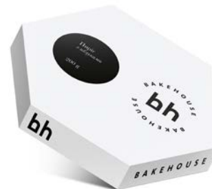
Bakehouse Brand Design & Food Packaging Design: banda.agency, Kyiv, Ukraine Client: Good Wine, Kyiv, Ukraine Red Dot Red Dot: Agency of the Year 2018