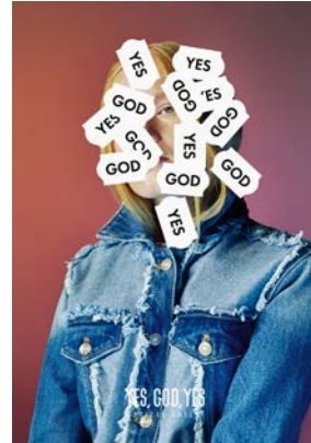
Yes, God, Yes Promotional Posters Design: banda.agency, Kyiv, Ukraine Client: Yes, God, Yes, Kyiv, Ukraine Red Dot Red Dot: Agency of the Year 2018

Red Dot: Agency of the Year 2018 is Banda Agency from Ukraine, which has been convincing again and again with creative solutions that are as unexpected as they are uncomplicated. Founded in 2011, this Ukrainian full-service agency has already done work for clients such as Comfy, Uber, Puma and the Eurovision Song Contest. It has won more than one hundred awards to date – including seven Red Dot awards in 2018 alone.