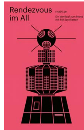
Rendezvous im All Promotional Posters Design: beierarbeit, Bielefeld, Germany Client: Spielkartenfabrik Altenburg, Germany; Bielefelder Spielkarten, Altenburg, Germany Red Dot: Best of the Best