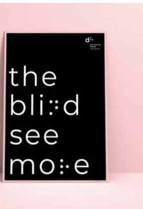
The Blind See More Typeface & Corporate Design Design: KW43 BRANDDESIGN/GREY Germany, Düsseldorf, Germany Client: discovering hands, Mülheim/Ruhr, Germany Red Dot