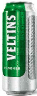
VELTINS Pilsener Beverage Packaging Design: Brauerei C. & A. Veltins, Meschede, Germany; Higgins Design, Hamburg, Germany Client: Brauerei C. & A. Veltins, Meschede, Germany Red Dot