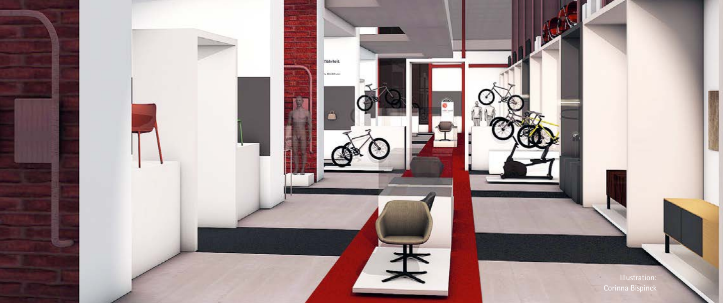
Illustration: Corinna Bispinck