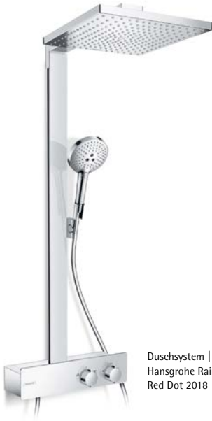
Duschsystem | Shower system Hansgrohe Raindance E Showerpipe Red Dot 2018