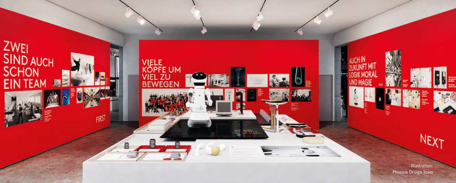
Illustration: Phoenix Design Team