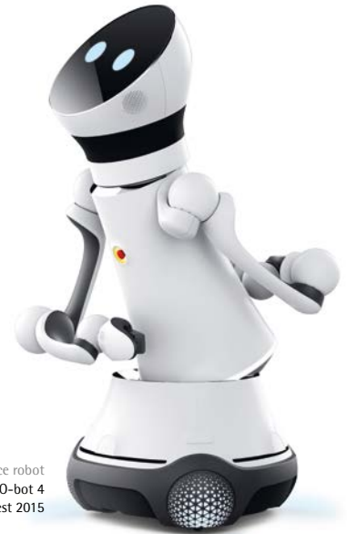
Service-Roboter | Service robot Care-O-bot 4 Red Dot: Best of the Best 2015

With its objects, the design studio creates real brand experiences for its clients and new impetus for the industry. Following the leitmotif "Without a past there is no future", the designers draw on their long-term experience.