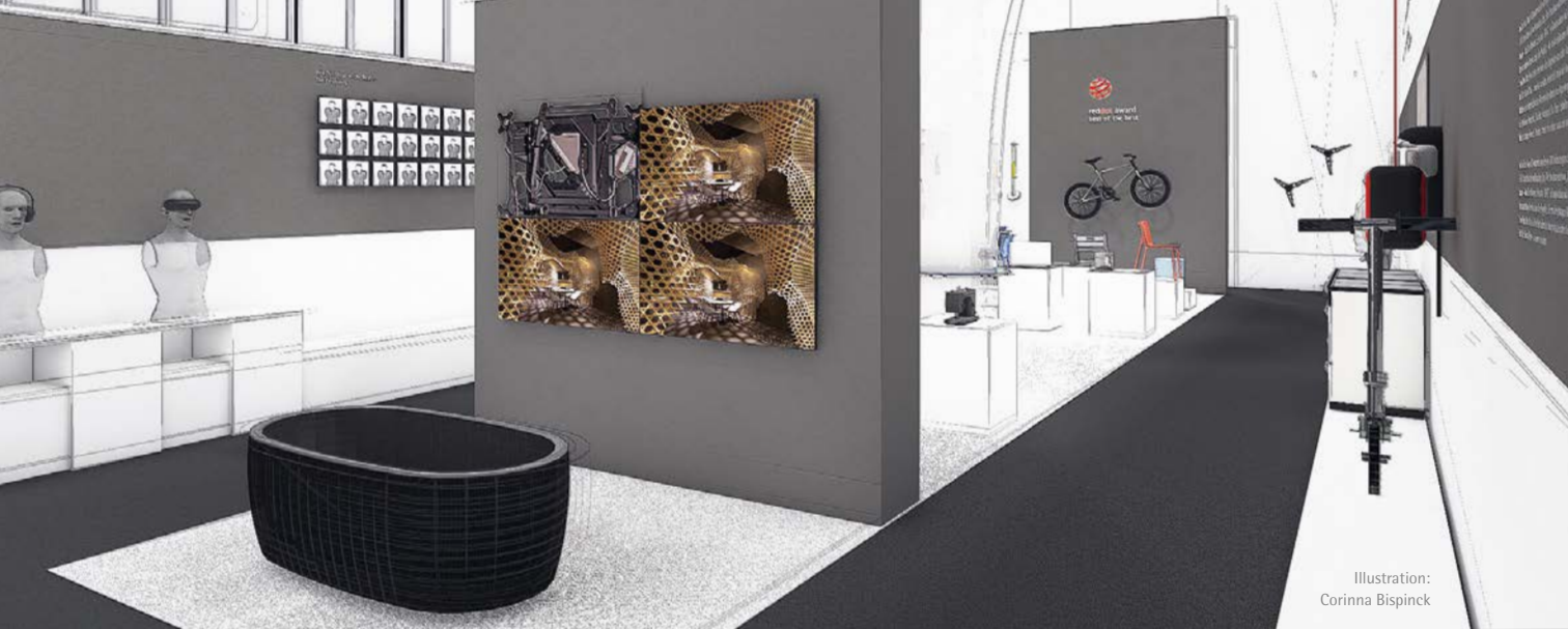
Illustration: Corinna Bispinck